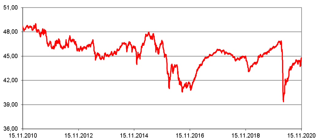
Entwicklung des Fondspreises (in €) Rücknahmepreise - um Ausschüttungen / Thesaurierungen bereinigt

Durchschnittliche Jahreswertentwicklung: