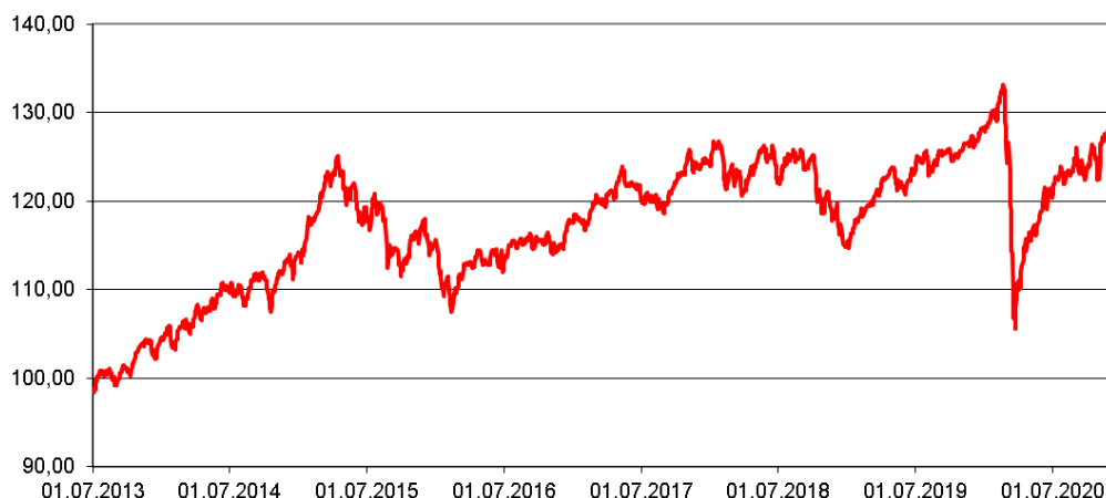
Entwicklung des Fondspreises (in €) Rücknahmepreise - um Ausschüttungen / Thesaurierungen bereinigt

Durchschnittliche Jahreswertentwicklung: