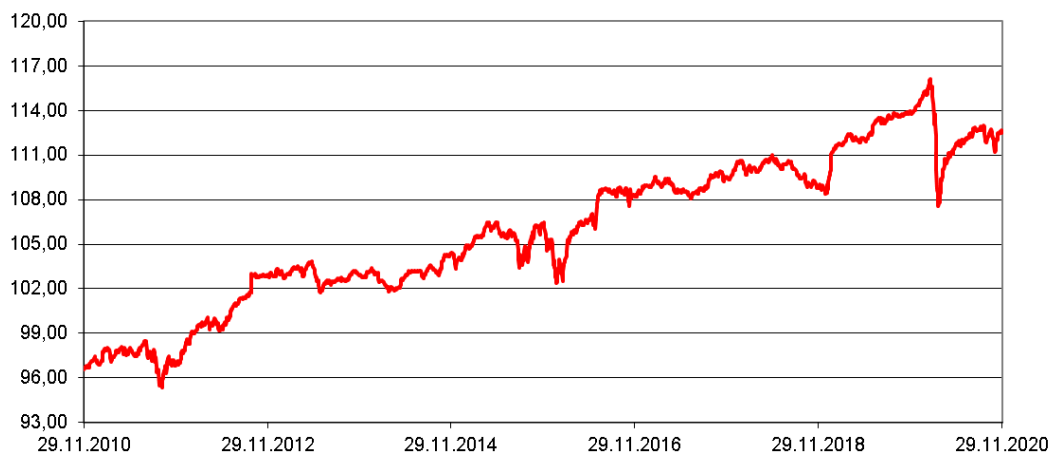
Entwicklung des Fondspreises (in €) Rücknahmepreise - um Ausschüttungen / Thesaurierungen bereinigt

Durchschnittliche Jahreswertentwicklung: